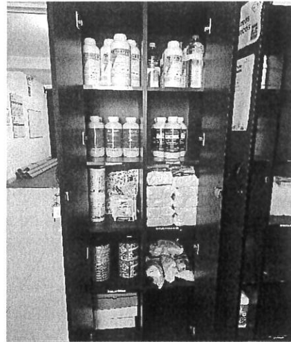
Foto 3 Área de almacenamiento de productos químicos