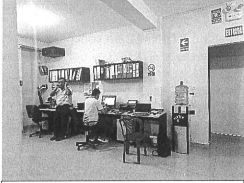
Foto 1 Área administrativa