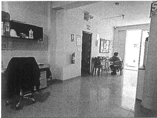
Foto 3 Área de vestuarios