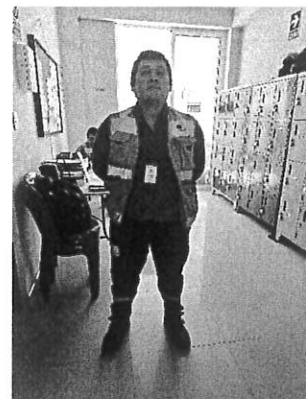
Foto 5 Personal con indumentaria con logo de la empresa en pantalón y chaqueta